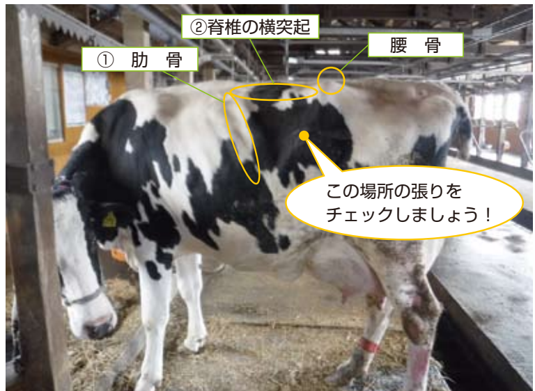
写真1 ルーメンフィルスコアの計測箇所