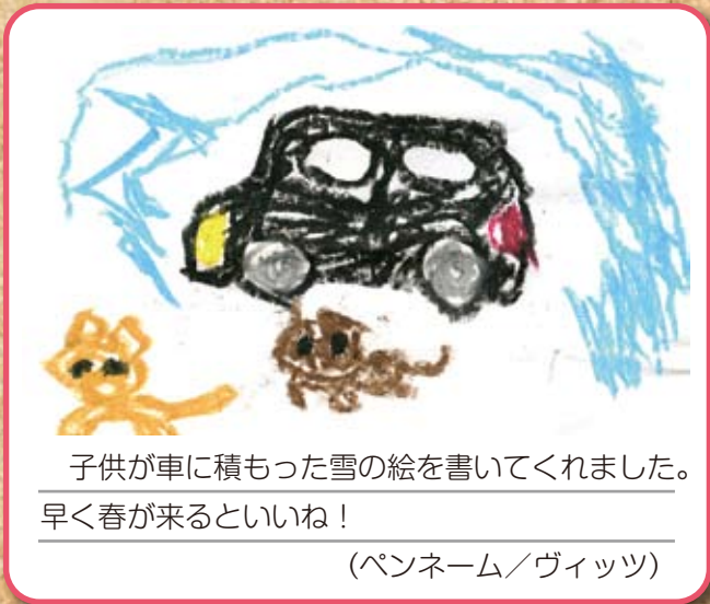
子供が車に積もった雪の絵を書いてくれました。 早く春が来るといいね！ (ペンネーム/ヴィッツ)