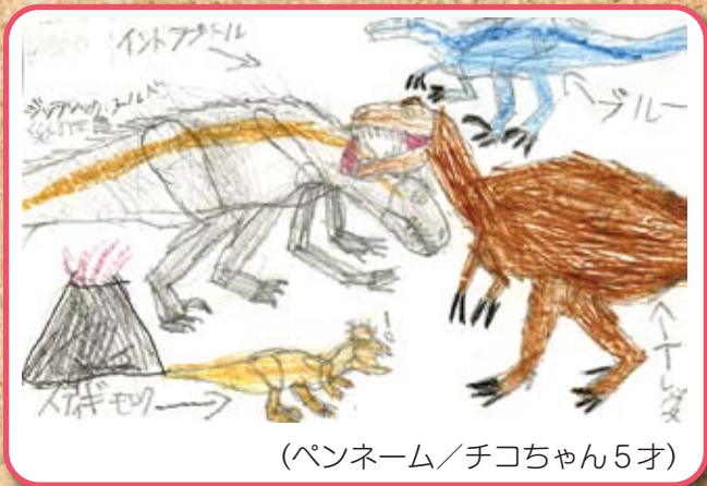
(ペンネーム/チコちゃん5才)

平成31年がスタートし、後数ヶ月で平成も終わってしまいますねえ…。その数ヶ月の中に39歳(サンキュウ)になります!! 今年は周りの人達にサンキュウを沢山伝えられる年にしたいなあ…。いやします!! (ペンネーム/うっちー)