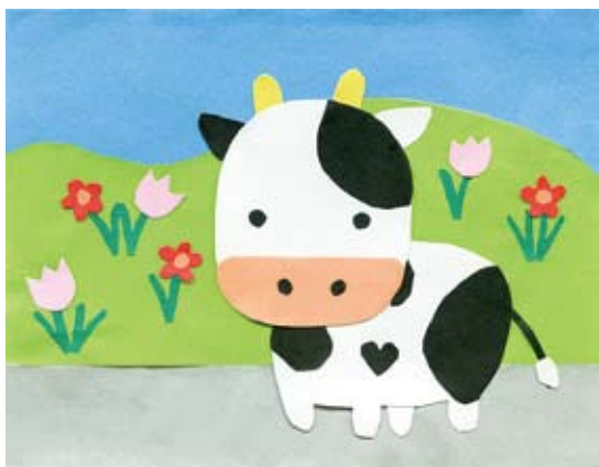
春が楽しみです。(ペンネーム/さつき)

暖かくなったり、寒かったり、体調管理が難しい時期ですね。1週間仕事しないで寝続けていたい気がします(笑) (ペンネーム/きらら)